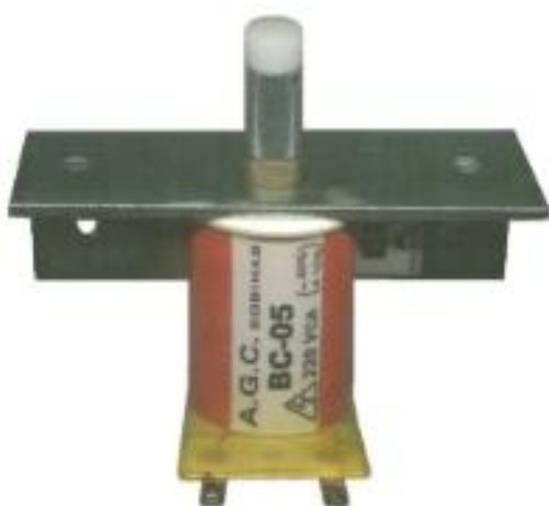
CÓDIGO EI-05-220 Mecanismo obturador universal completo 220 VAC